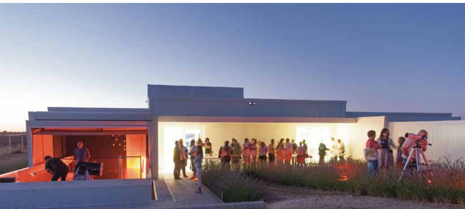
Centro Astronómico de Tiedra