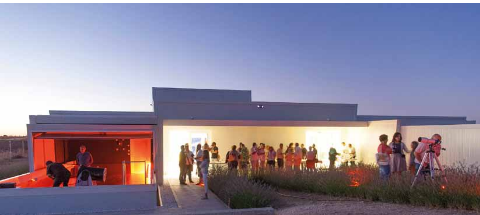
Centro Astronómico de Tiedra